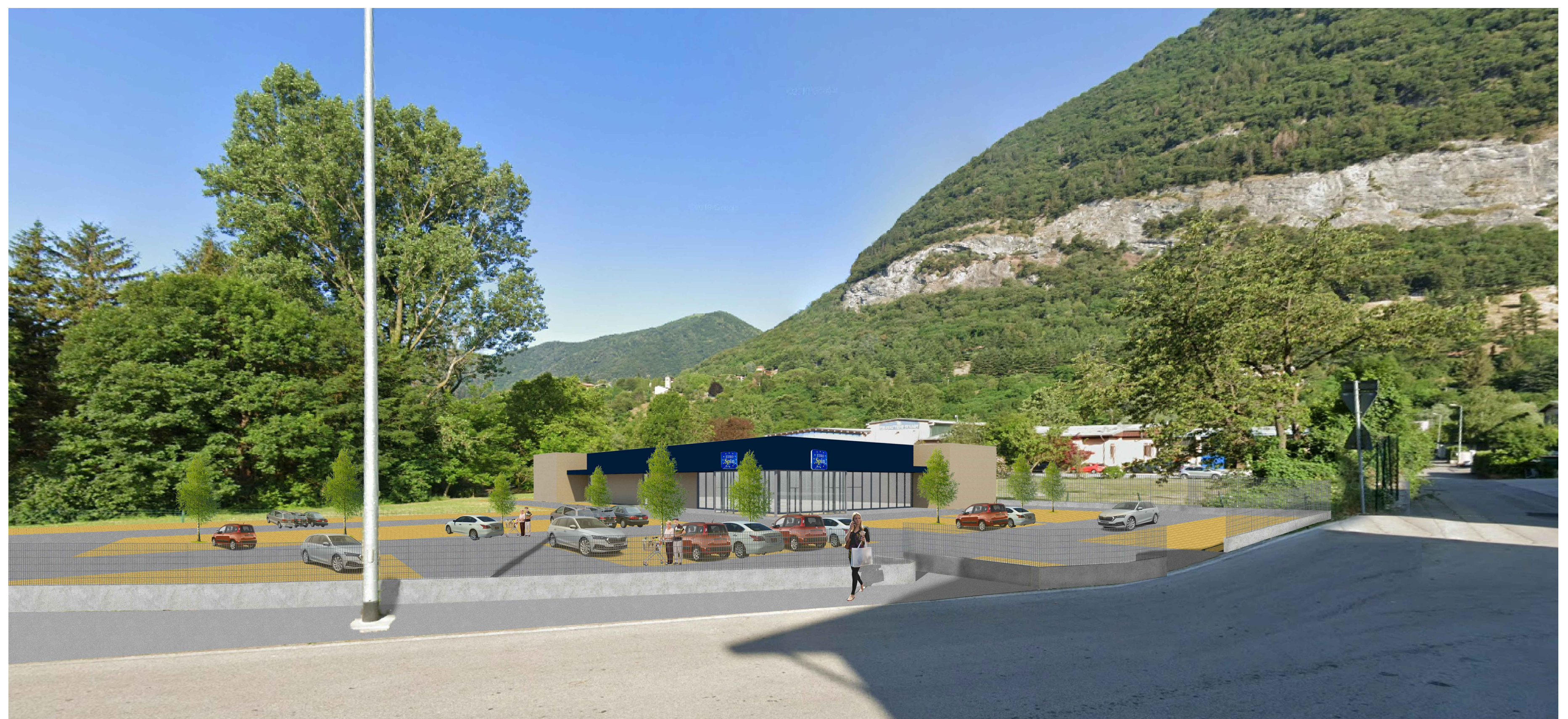
Rendering - inserimento paesaggistico del progetto